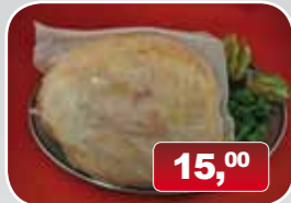
Beenham kant en klaar